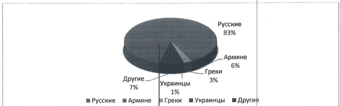
Рис. 2 – Этническая структура населения города-курорта Железноводска

Город-курорт Железноводск исторически сформировался как мультикультурный и полиэтничный населенный пункт, ядром которого является русский народ. По итогам Всероссийской переписи населения 2010 г. в городе-курорте Железноводске выявлены 44 национальности (Рисунок 2). Из них самыми многочисленными национальными группами оказались русские (83 %), армяне (6 %), греки (3 %) и украинцы (1 %).